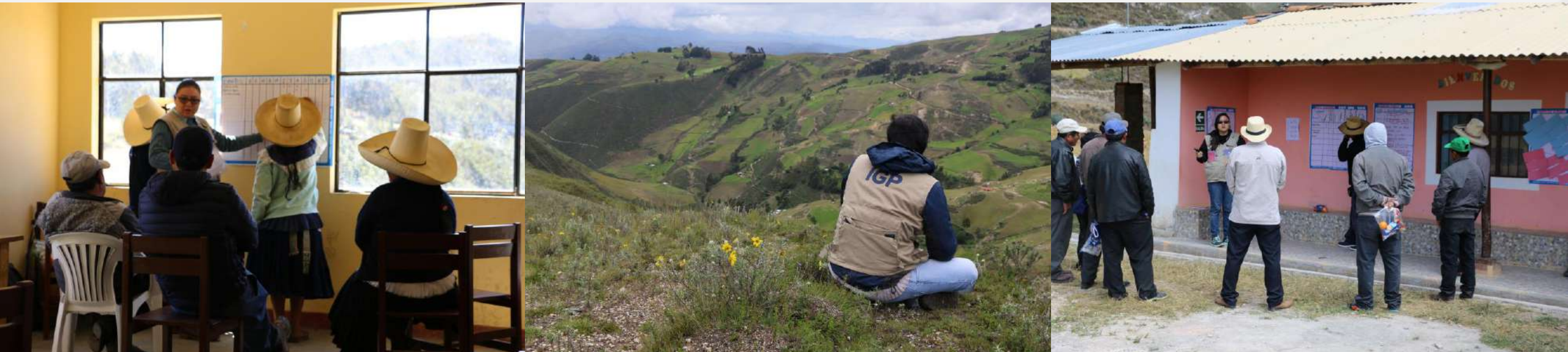
Ecosistema de páramo andino: Ronquillo (Cajamarca)