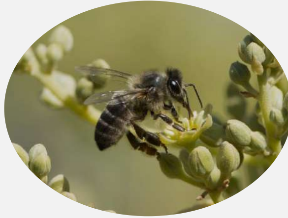
Servicios de regulación