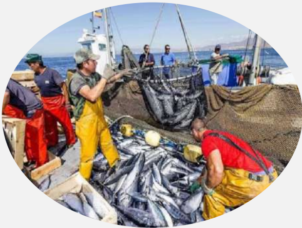
Servicios de abastecimiento