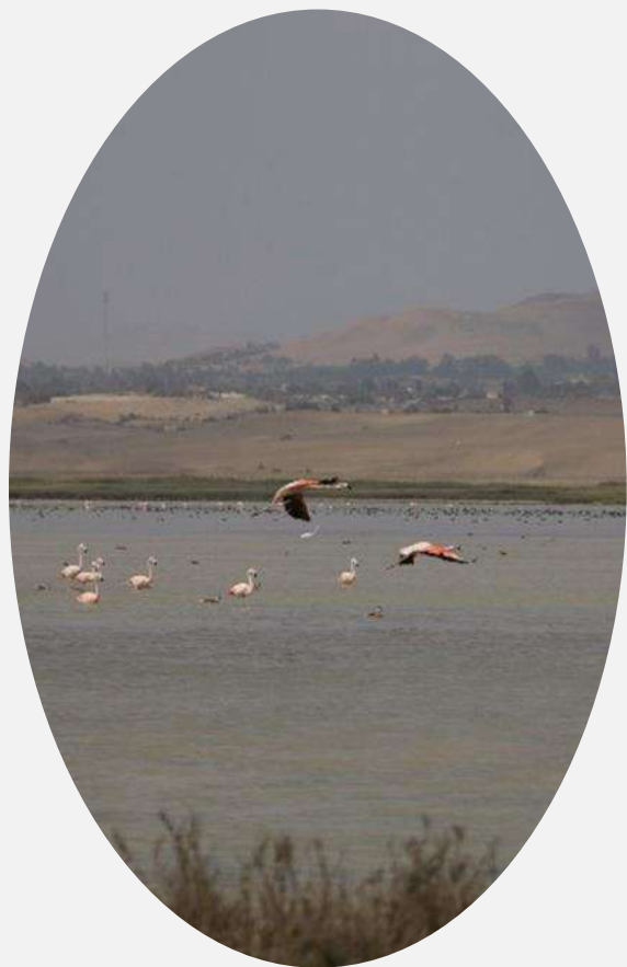
Ecosistema humedal costero: albufera Paraíso (Huacho)

Regulación y almacenaje de agua para consumo directo