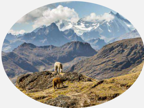
Servicios de apoyo